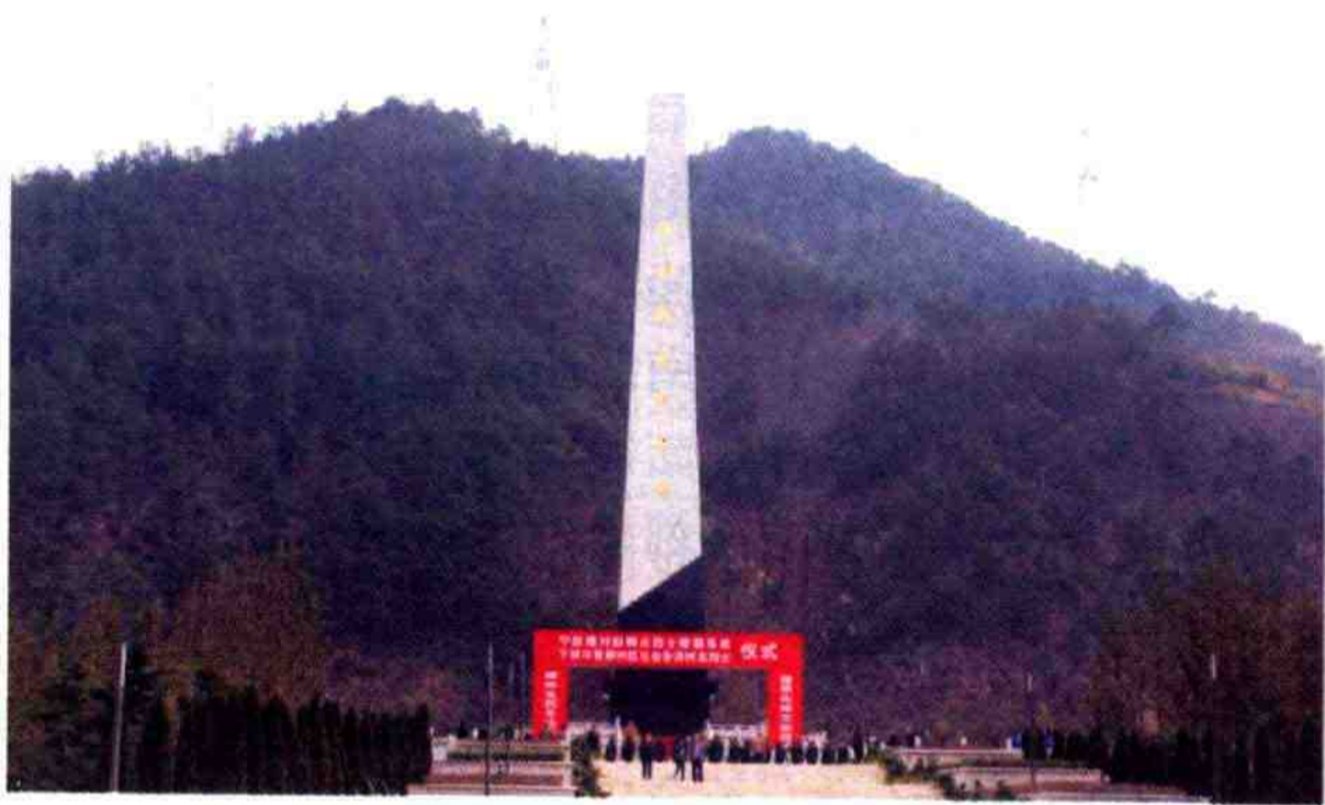
陵园内的革命烈士纪念塔

墓。1953年，又在纪念塔前两侧建造了两座五角形纪念碑亭；在烈士公墓后面又增建5座烈士公墓，安放了146具英烈灵柩，成为浙江省最早建立的革命烈士陵园之一。以后，中共鄞县县委和县人民政府多次对烈士陵园进行扩建和整修。2009年6月，宁波市鄞州区人民政府对烈士陵园进行一次大规模的扩建，至2011年3月底竣工。总投资3亿多元，总用地面积101407平方米，总建筑面积6243平方米，主要由纪念塔、烈士纪念