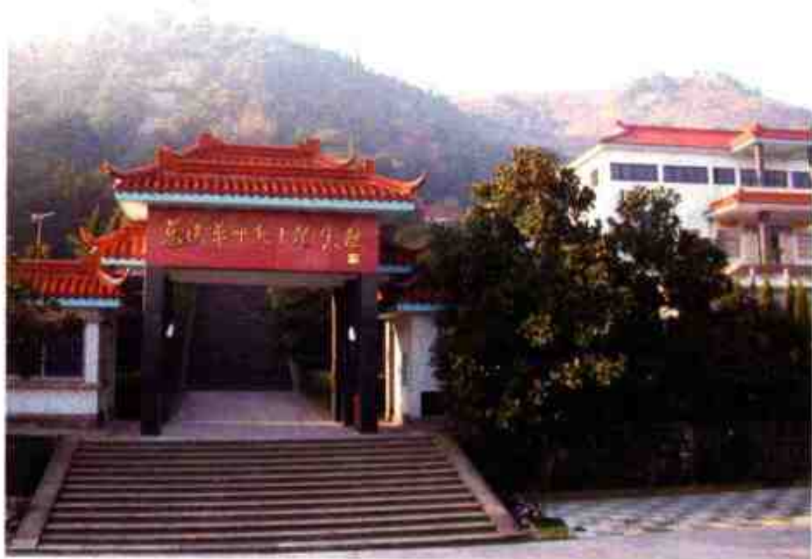
慈溪革命烈士纪念馆

慈溪革命烈士纪念馆： 位于慈溪市城区南郊脉云山麓。筹建于1990年，1993年夏竣工，1995年清明节正式对外开放。慈溪革命烈士纪念馆是为纪念从辛亥革命至今为共和国献身的慈溪籍烈士和牺牲在慈溪的客