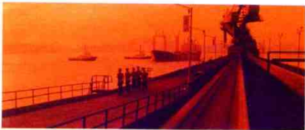
宁波港对外开放后，外轮陆续来甬

★32.宁波港对外开放 1973年2月，周恩来总理提出“三年改变我国港口面貌”。3月，国务院成立港口建设领导小组。7月，领导小组组长粟裕到宁波考察港