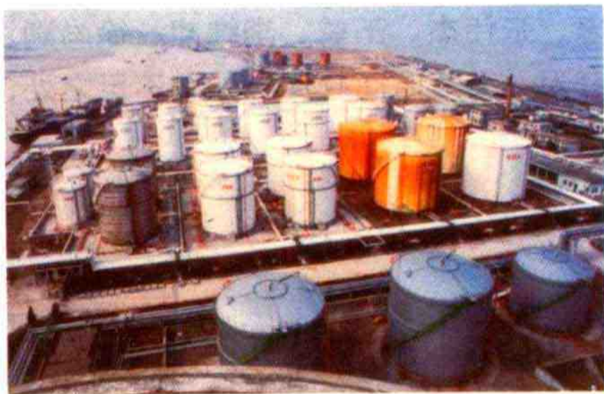
宁波北仑港镇海港区液体化工品码头

增幅位居我国8大港口和全球30大港口之首，集装箱吞吐量排名大陆港口第3位，并进入世界港口前6强。