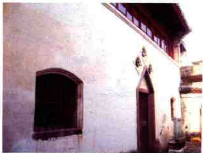
中共象山工委旧址（山海楼）

作委员会。1998年10月，象山县委党史办、新桥镇政府、县文管会办公室筹资3万元对山海楼进行了修缮。其中2间为“中共象山工