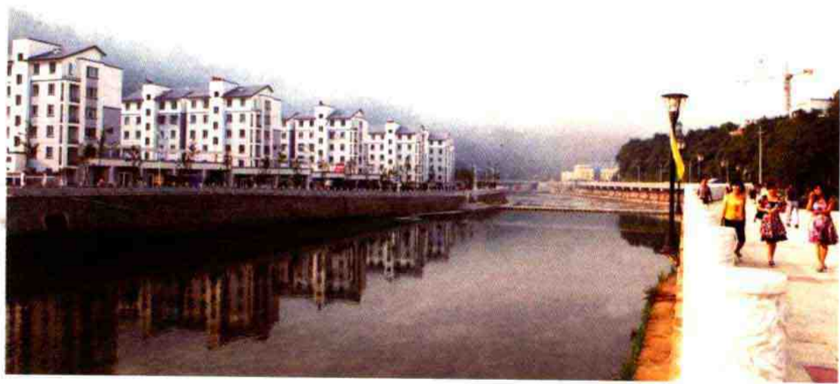
宁波援建的青川新县城一角

★59.宁波市千里驰援四川抗震救灾 2008年5月12日，四川汶川大地震突如其来，宁波市委、市政府按照中央部署要求迅速开展抗震救灾工作。抗震救灾阶段，