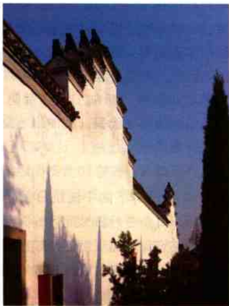
中共浙东区委成立处旧址

★14.中共浙东区委的成立 1941年2月，中共中央做出开辟浙东战略基地的决策。5月至7月，华中局和新四军军部派大批干部到达浙东。7月28日，在慈北宓家埭宓大昌家，成立了由谭启龙、何克希、杨思一、顾德欢4人组成的中共浙东区委，谭启龙任书记。12月2日，经中央批准，浙东区党委改组，谭启龙任书记，何