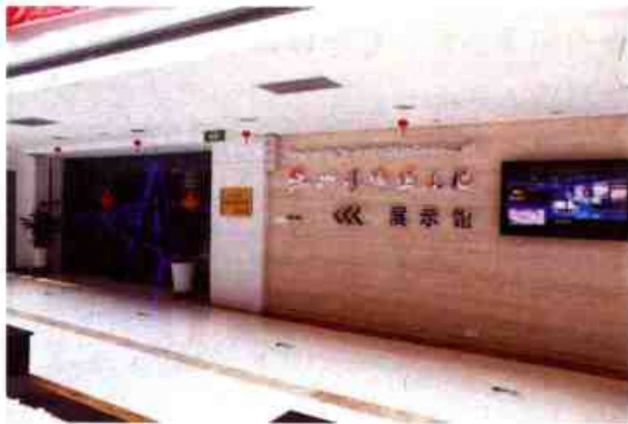
杭州湾跨海大桥展示馆

通过图文展板、实物展出、多媒体影片循环播放等方式展现红色通道的重要历史意义和现实意义。现为宁波市中共党史教育基地。