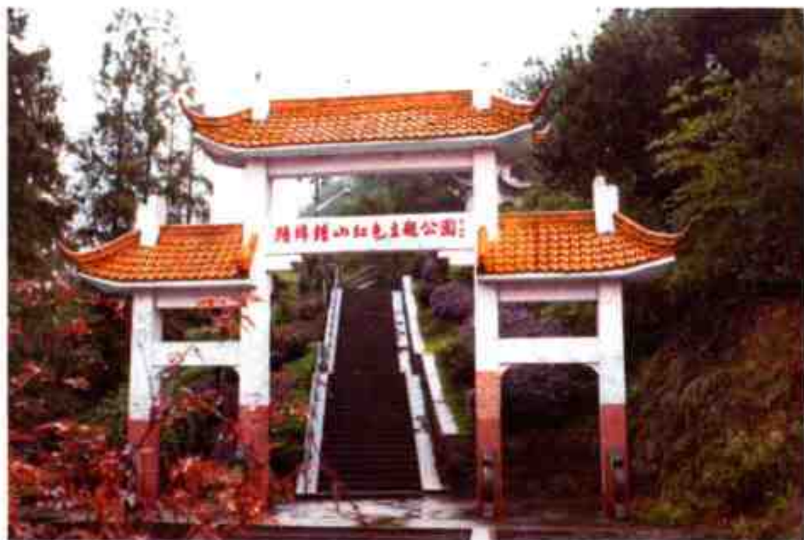
陆埠钟山红色主题公园

陆埠钟山红色主题公园： 位于余姚市陆埠镇撞钟山。园内有谭启龙书写的“革命烈士永垂不朽”纪念碑。自1997年至2006年先后投入资金260余万元，分四批建成革命烈士纪念碑、《新浙东报》纪念碑亭、