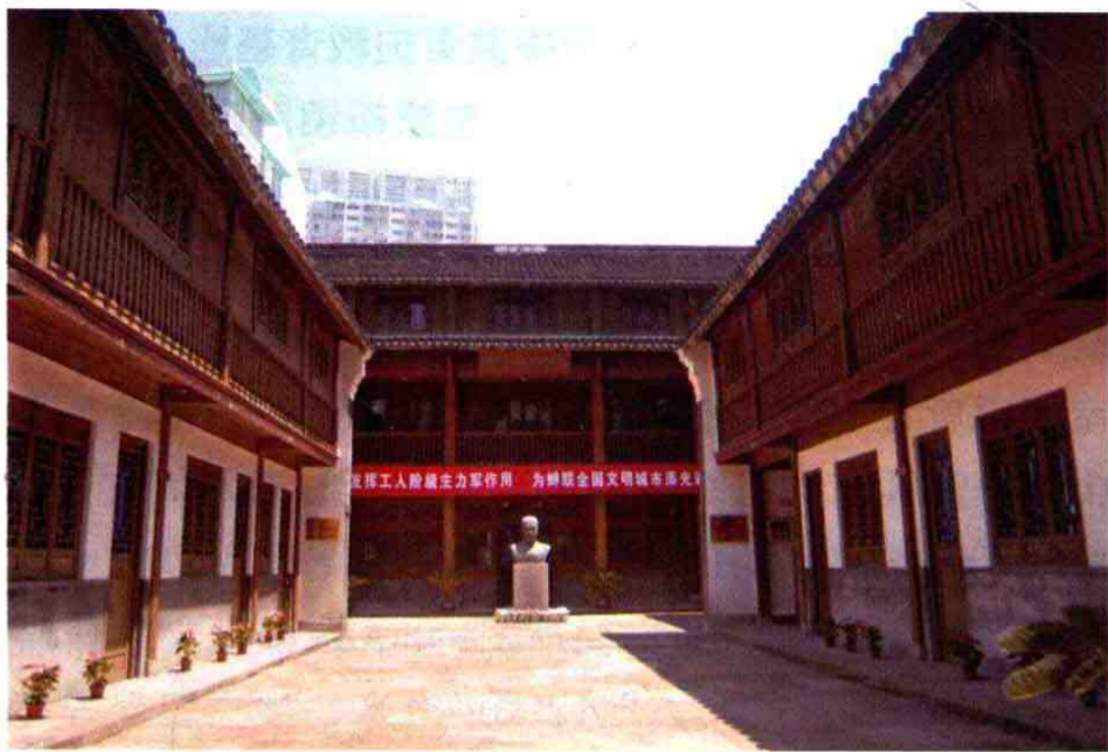
大革命时期宁波总工会旧址

分六个部分详尽展示了宁波工人阶级在各个历史时期的斗争风貌。后因城建原因造成“旧址”地基破坏，2003年10月，宁波市人民政府拨款214万元对“旧址”进行整修。整修后的“旧址”安放王鯤烈士青铜雕塑一尊，陈列宁波工人运动史料，并重新对外开放。现为浙江省文物保护单位，宁波市爱国主义教育基地、市中共党史教育基地。