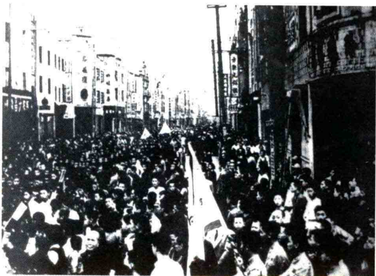
宁波人民在中山路集会游行，欢庆解放

★20.人民解放军挺进浙东和宁波的解放 1949年4月，中国人民解放军百万雄师横渡长江、解放南京之后，第三野战军第七兵团第二十二军和第二十一军第六十一师奉命进军浙东。5月22日上午，浙东游击纵队第五支队与二十二军六十五师先头部队一九三团，在姚南箬竹岭胜利会师。5月23日、24日，余姚、慈溪解放。5月25日拂晓，由灵桥进入市中心的六十五师一九五团，与从西郊进入市中心的六十四师一九〇团胜利会师，宁波（鄞县）解放。同日，二十一军六十一师攻占奉化县城，奉化解放。次日，二十二军六十六师进占镇