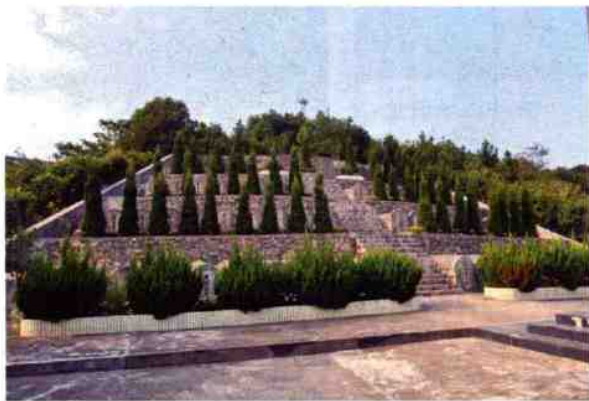
大榭革命烈士陵园

大榭革命烈士陵园： 位于宁波大榭开发区内，是为纪念解放大榭岛战斗中牺牲的革命烈士，于1983年兴建的。解放大榭岛战斗被誉为“渡海第一仗”，是我