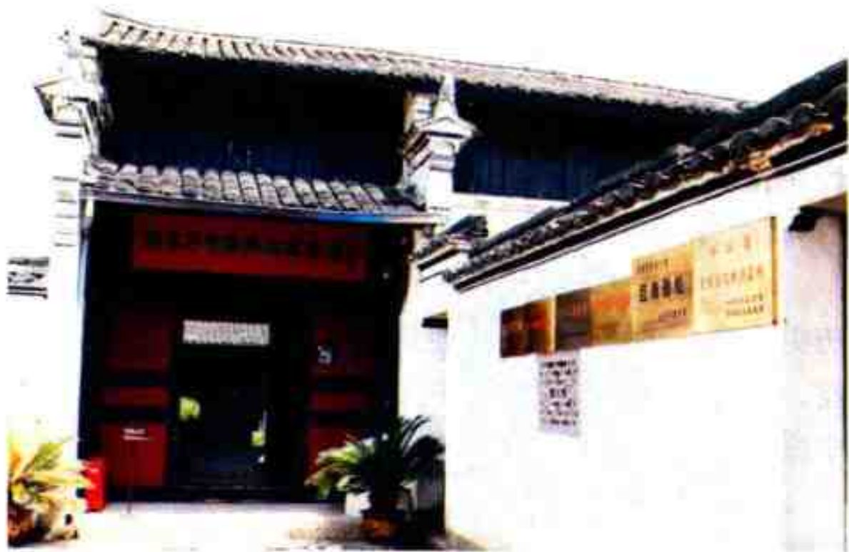
中共浙东区委旧址

斗争。在党的八七会议精神指引下，很快在宁波掀起了土地革命的风暴。宁波地委改为市委、县委，先后隶属浙江省委和中央直接领导。1927年11月到1932年4月间，宁波党组织经历了6次遭破坏、4次重建的曲折过程。组建起“亭旁红军”、“浙东工农红军第一师”等农民革命武装，先后发动了奉化、亭旁、姚北等著名的武装暴动，成立了全省最早的红色苏维埃政权——亭旁区革命委员会。虽然武装暴动均告失利，但作为当时全国百余次武装起义的一部分而影响广泛，为全党探索中国革命的正确道路提供了宝贵的经验与启示。土地革命战争时期，宁波共有7名市（县）委书记遭逮捕，其中3人被杀害；有5名宁波籍的和曾经在宁波工作过的浙江省委或代理书记先后牺