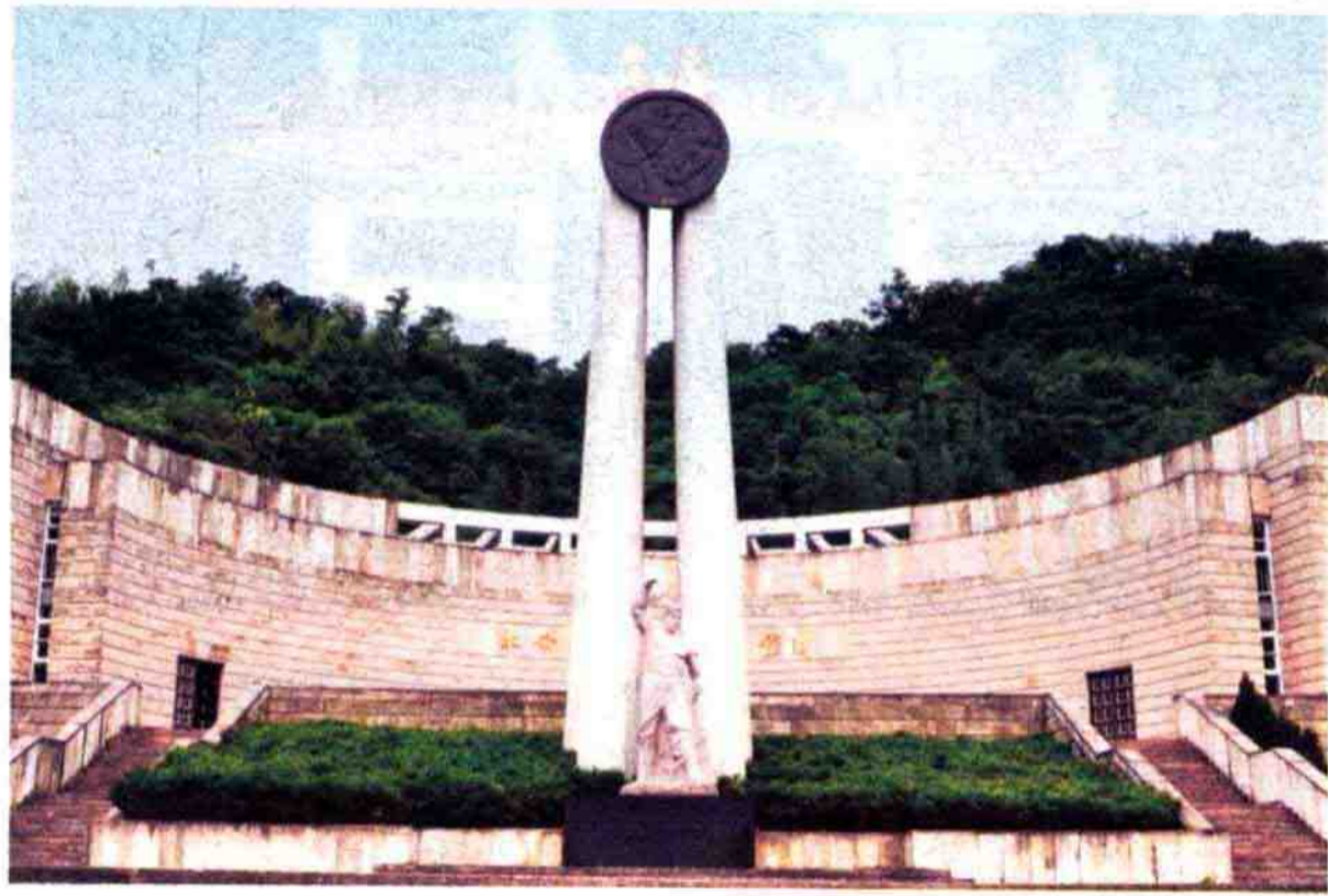
北仑革命烈士纪念馆

北仑革命烈士纪念馆： 位于宁波市北仑区凤凰山东麓。1991年，中共宁波市北仑区委在新碶镇星中路、东河路交汇处建造了北仑革命烈士纪念馆。2000年4月，迁至现址，新建的纪念馆占地2736平方米，建筑面积400平方米。纪念馆主体以乳白色花岗岩为基调，正面墙上嵌着由中共浙江省委原书记谭启龙