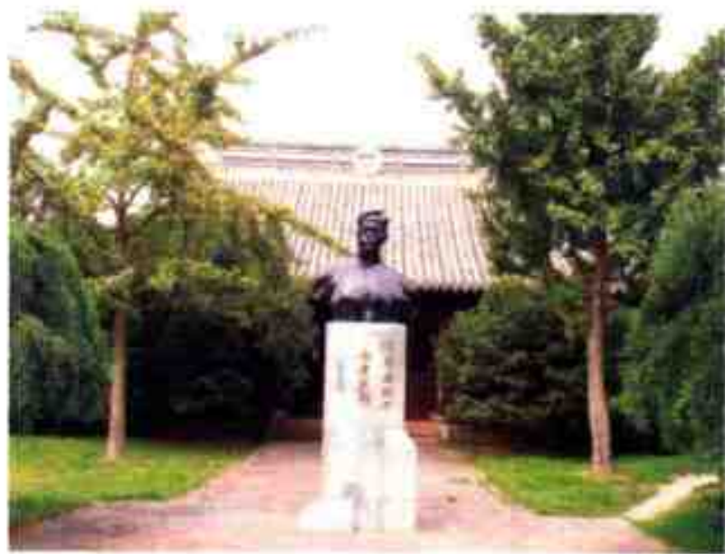
寿昌公园内的陈寿昌烈士铜像

寿昌公园： 位于宁波市镇海区招宝山街道聪园路595号。1992年初，中共宁波镇海区委、区政府决定将正在建造的古塘公园改名为寿昌公园，并在公园内建造陈寿昌烈士纪念馆。同年3月开工建设，11月竣工并对外开放。寿昌公园和陈寿昌烈士纪念馆采用江南园林设计，纪念馆占地面积5500多平方米，建筑面积近1000平方米。场地正中央矗立着陈寿昌烈士半身铜像，铜像的基座铭刻着聂荣臻元帅的题词：“陈寿昌烈士永垂不朽”。陈寿昌烈士纪念馆内珍藏了烈士照片、遗物