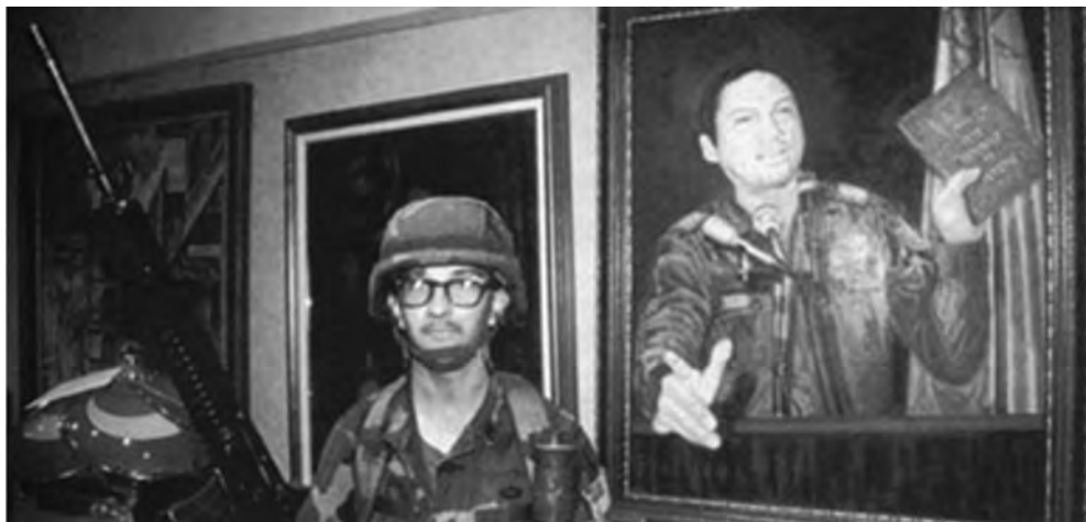
◎一名美军士兵在巴拿马总统诺列加的照片前照相

战争中，美军亡27人，伤330人，毁武装直升机1架、损伤运输机14架；巴军亡314人，伤123人，被俘2969人，平民亡100人，伤数百人，另有2.8万人无家可归，直接经济损失20亿~25亿美元。