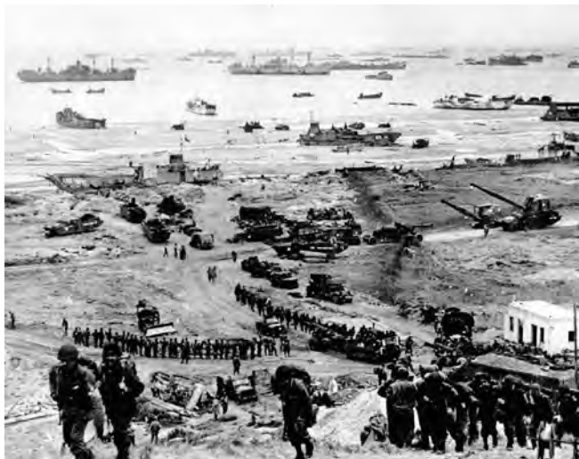
◎登陆诺曼底的美军士兵

夺取海滩堤道和主要桥梁，占领主要登陆地段翼侧要点，阻止德军增援和保障登陆部队突击上陆；之后，数千艘运输船、登陆艇和其他军舰载运着美、英盟军5个师的先头部队发起登陆作战。6~7日，盟军已登陆部队达17.6万人，车辆2万台。至6月12日，各登陆地段连成正面80公里、纵