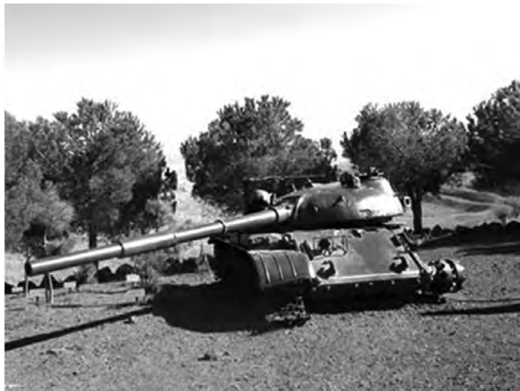
◎戈兰高地坦克战中被击毁的坦克

叙利亚坦克会战失败的原因不是因为集中兵力本身的错误，而在于集中兵力后战场战术上的失误。他们仍然沿袭第二次世界大战的苏式战术，即集群坦克