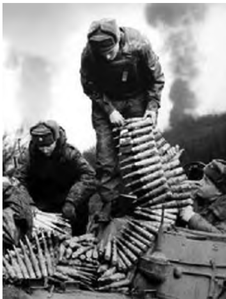
◎正在装填弹药的俄军

10月1日，俄军兵分三路突入车臣境内，对车臣北部形成三面夹攻之势；10月6日，俄军完全封锁车臣边界，并控制了车臣1/3的地区；10月26日，俄军包围格罗兹尼。11月中旬至12月初，俄先后解放车臣第二大及第三大城市。12月25日，俄十万大军向格罗兹尼发动进攻，于次年2月6日完全控制