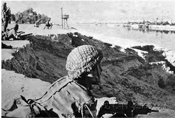
◎作战中的埃及士兵

而将首要打击目标锁定为埃及。在时间选择上，以色列认为，凌晨5时左右太阳升起的时候对以方有利，敌人经过一夜的戒备，这时容易放松警惕，而且初升的阳光照射埃及一方，不利于埃军迎战。