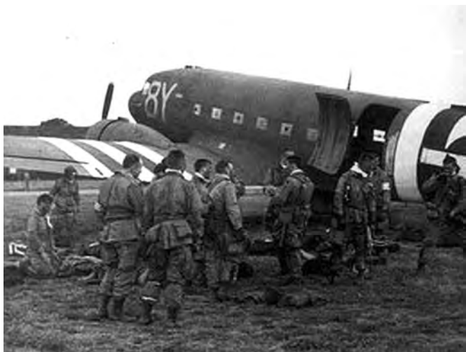
◎登机前的美军伞兵