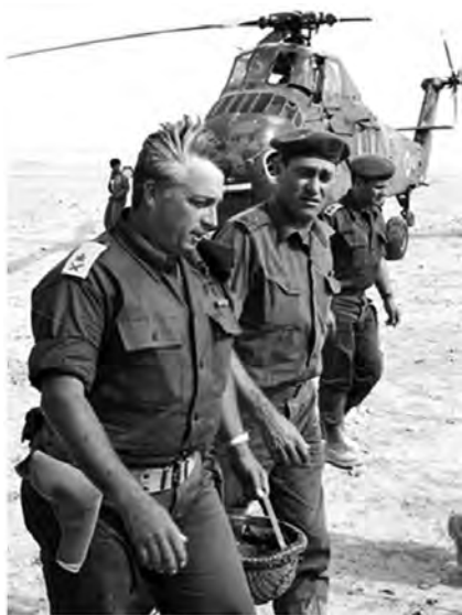
◎第五次中东战争中的沙龙

作战阶段，以色列首先对巴解游击队的军事设施实施几十批次的轰炸和炮击，扫清前进路上的一切障碍。接着，在长达 6 小时的火力准备之后，以军地面部队在海、空军及炮兵的火力掩护下，穿过以、黎边界，经过 8 天的激烈交战，以军向北推进 90 余公里，占领黎巴嫩 3000 平方公里的领土，摧毁了巴解在黎南部的全部基地。据以色列 6 月 14 日公布的数字，在以军大规模进攻阶段，共击毙巴解游击队 2000 人、叙军 1000 人，俘巴解 6000 人、叙军 80 人；击落叙军飞机 90 架（含直升机 5 架），击毁叙军坦