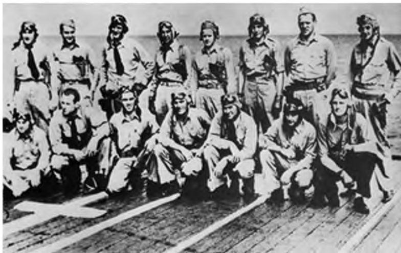
◎太平洋战争中的美军飞行员

由于马里亚纳群岛的几大岛面积都比较大，日军防御兵力都有数万之众，美军必须投入优势