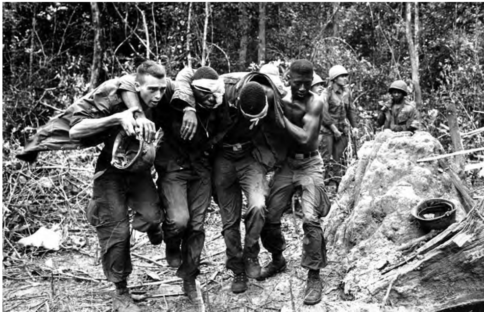
◎越战中的美军士兵

此，越南战争还对美国解决其他迫切问题产生了严重的干扰，在国内也引起民怨沸腾，甚至战争失败所带来的挫折和沮丧情绪弥漫于美国民众中间，产生了长久的消极影响。战争导致美元贬值和美国国力的明显削弱，使其原有的对苏优势逐渐消失，直接促成了70年代美苏攻守之势的逆转。时至今日，越战的教训也依然对美国政府、军界产生着警醒的作用，越战的梦魇依然在一些美国人心中挥之不去。