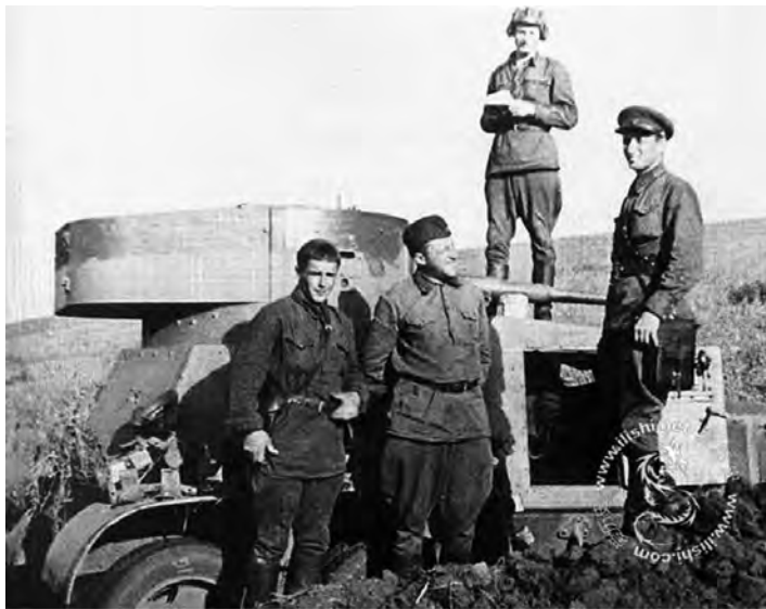
◎诺门坎战役中的苏联士兵