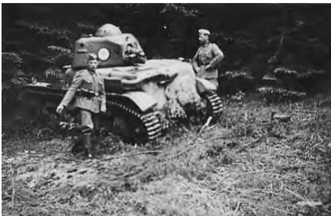
◎德军缴获的法国雷诺坦克

德军控制欧陆大片土地后，仅缴获的武器装备就可武装 100 多个师。其余还有数百万辆各式交通工具，15 亿美元以上的黄金外汇，大量的工业制成品。德国的原料和燃料也主要通过通过对占领区的大量掠夺来补充，仅铁矿石一项，1942 年德国就从被它占领的洛林和卢森堡等地掠夺了 1730 万吨。在农产品方面，仅粮食就解决了德国战时需要的 1/7 ~ 1/5。德国新老垄断集团通过没收、