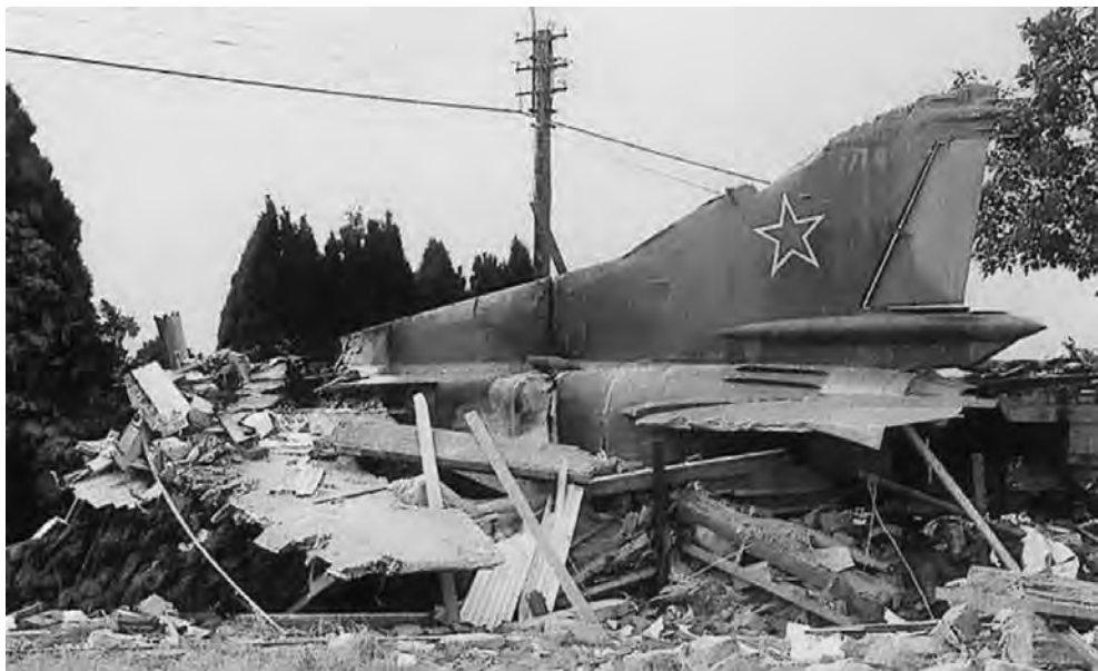
◎被击落的米格-23 战斗机

以色列对黎巴嫩的入侵蓄谋已久。早在 1982 年 1 月，以军就拟定了代号为“加利利和平行动”的作战计划。计划中，除了确定以武力消灭巴解游击队外，削弱驻黎叙军、拔除其在贝卡谷地的防空导弹基地也是一项重要内容。在前一年