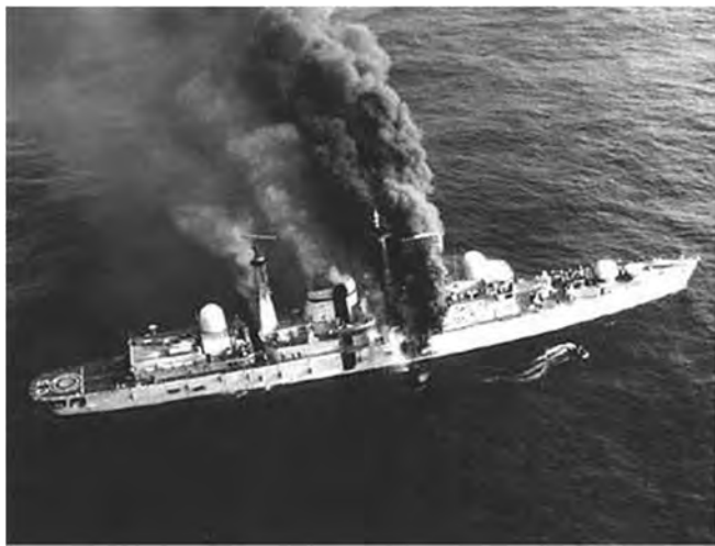
◎被“飞鱼”导弹击中的英国“谢菲尔德”号驱逐舰

在战争准备上，阿根廷虽有以武力攻占马岛的决心，但却没有抗击英军大规模登陆的思想准备，获悉英国决定出兵后，才仓促向岛上增兵和赶运物资，处于十分被动的地位。据估计，守住马岛至少需要 5 万人，而战争初期阿军参战兵力不到 1 万人，仅占总兵力的 6%，后虽努力向马岛增兵，却又因英军的海、空封锁而难以如愿。另外，武器装备的准备、战场准备以及后勤保障准备等方面，阿军也都暴露出不足。