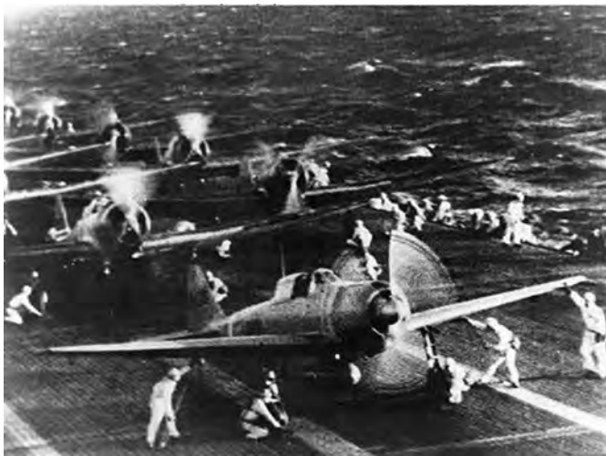
◎日本海军的飞机从“翔鹤”号航母上起飞袭击珍珠港

1941年11月8日，日本海军先遣队的潜艇假装日常巡逻，出发驶向夏威夷的瓦胡岛，侦察和监视美国太平洋舰队的活动。11月26日，突击编队起航。在海上航行过程中，实行24小时对空、对潜警戒和保持无线电静默。夏威夷时间7日4时，突击编队在瓦胡岛以北230海里的海域展开；5时30分派出水上飞机进行侦察；6时至6时15分，担负第一轮攻击的183架飞机起飞。