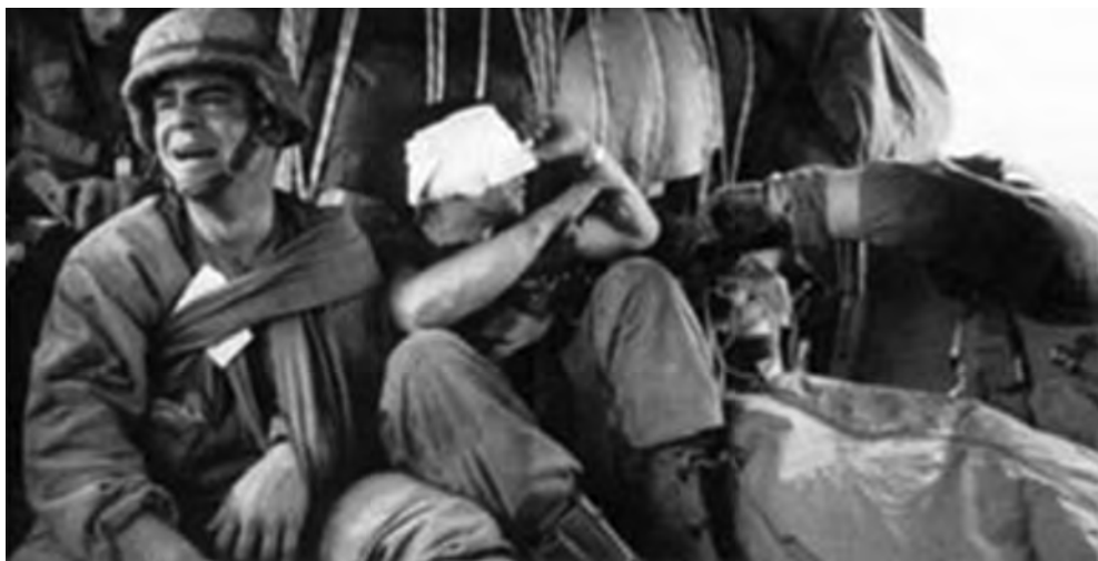
◎一名美军得知他战友牺牲时，不禁失声痛哭

2月26日，多国部队加快了进攻速度。东线美海军陆战2师攻占了科威特市西面的穆特拉山口高地，切断了科威特市区伊军的退路。陆战1师在美海军和陆战队航空兵的火力支援下，抢占了科威特市南郊的国际机场。西线主力美18空降军转向东北进攻，于当日中午攻占所有规定目标，控制了伊拉克南部重镇巴