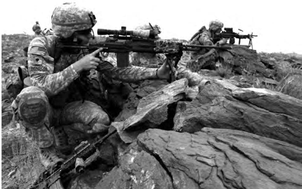
◎战争中的美军士兵

南联盟仅有 10 万平方公里的国土，缺乏战略纵深。其现役军人为 11.4 万，预备役 40 万；装备 170 架飞机，但其中只有 15 架米格 -29 能对北约飞机构成一定的威胁；导弹为较落后的“萨姆”型，萨姆 -2、萨姆 -3、萨姆 -6 地空导弹共计 1000 枚。而形成鲜明对照的是，作为世界上最强大的军事集团，经济实