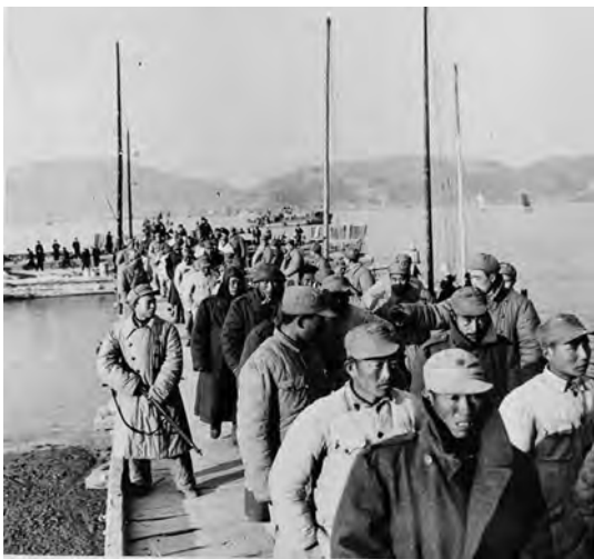
◎押送国民党军战俘

1954年5月中旬以后，华东军区鉴于国民党军在浙东沿海岛屿的指挥中心和防御核心是大陈