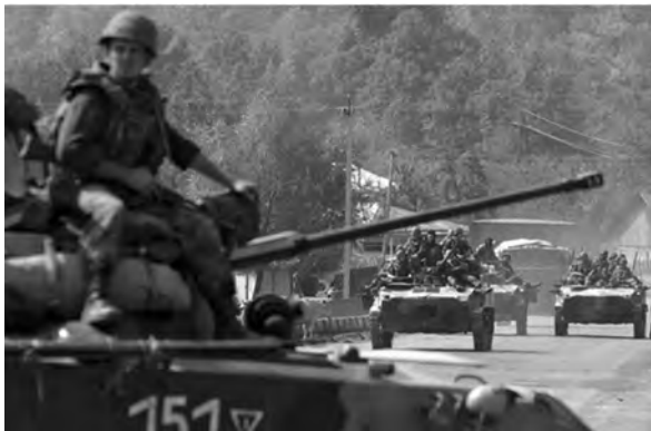
◎俄军装甲部队进入南奥塞梯

境地区的军事冲突作准备。2008年6月，格鲁吉亚传出可能加入北约的消息后，双方即处于交战的边缘。8月7日，俄罗斯军队即与格鲁吉亚军队在南奥塞梯地区发生了大规模武装冲突。