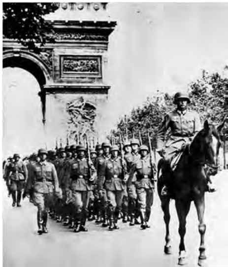
◎穿过巴黎凯旋门的德军

有战斗力的军队，士气高昂往往是其共同的特点。士卒打仗，离不开物质利益的鼓动。适度的物质奖励，不仅能使士卒减缓因战争带来的压力，而且还可有机的调动士气。与此同时，这也是“因粮于敌”补给原则的实施方法。从这里看出，将帅对士卒心理状态的把握，对战争进程有着重要影响。将帅在指挥部属奋勇杀敌之余，也必须注意及时激发士卒冲锋陷阵于疆场的情绪，使部队始终保持克敌制胜的能力。