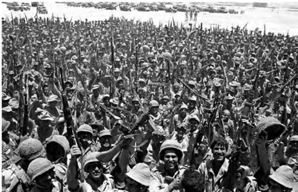
◎获胜后的以色列士兵