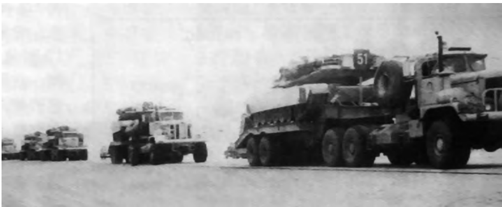
◎多国部队集结于沙特

正是认识到地理因素上的利弊，双方在战争之前和进行中，都高度重视地理方面的准备。伊拉克在战前广泛搜集了以色列、沙特阿拉伯和叙利亚等国的军事地理情报，绘制了科威特及其附近地区的精密地图。而美国以几十年前对海湾地区的军事地理分析为基础，战前又对该地区的地貌、气候、水文地理、土壤、植被和地质等自然因素，领土辖区、民族、宗教和文化等人文因素进行研究，搜集编写出了各种军事地理资料。