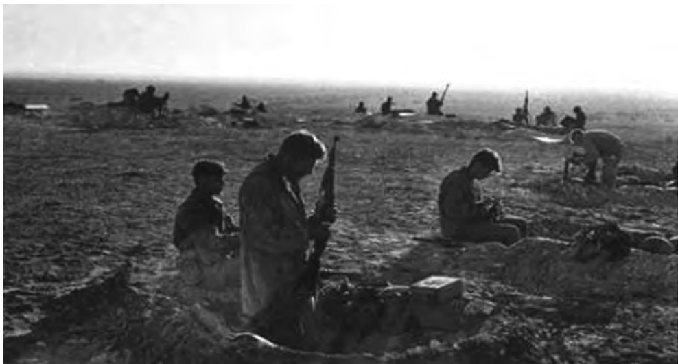
◎战壕里的埃及士兵

1956年10月29日，以军率先发动进攻，第二次中东战争开始。在埃军的顽强抵抗下，以军部队行动受挫。10月31日，英法加入战团，对埃及的主要空军基地、机场、兵营以及开罗、亚历山大、塞得港、苏伊士等城市的重要设施进行了轰炸。在英法的支援下，埃军损失加大，在西奈战役和塞德港保卫战中失利。然而，英法的行为受到了国际社会的强烈谴责，11月1日和3日，联合国两次召开大会呼吁双方停火。迫于压力，英法于11月6日下午指示英法联军于当日24时前停止战斗。随后，按照联合国决议，英法于12月22日全部撤军，