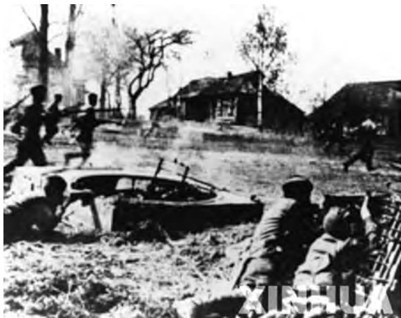
◎苏联红军在进行巷战

1941年9月30日，德军发动疯狂进攻。仅仅几天时间，德军便从多处突破苏军防线，向东挺进200余公里，进入莫斯科接近地。但是，德军遇到了苏军越来越顽强的抵抗，自己的供应也日益困难，而随着天气变冷，未作好酷寒条件下作战准备的德军陷入进退不得的困境，德军于是被迫全线停止前进。德军暂时的停歇为苏军赢得了宝贵的喘息时间。到10月底，苏军最高统帅部开始抽回一些部队作为预备队，使其得到必要的休息，新的预备队也在源源不断地赶到。而德军虽遭受重大损失，但仍增调兵力，变更部署，企图在冬季到来以前合围并占领莫斯科。10月底，希特勒集中51个师，包括13个坦克师和7个摩托化师的兵力，再次强攻莫斯科，一度进至距莫斯科仅20公里之处。苏军虽然经常处在危